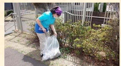
駐車場周辺のゴミ集め