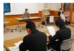
支援機関事業説明会の様子

小学部から高等部まで、進路指導を生き方指導と位置付け、保護者の協力を得ながら、「進路指導の手引き」をもとに、個別面談、作業学習の強化、事業所見学、校内・現場実習、面接練習など、計画的、継続的に行っています。一般的に行われる進学指導、就職指導だけでなく、障害者福祉サービスに係る申請や福祉事業所との契約・連絡調整等も行っています。